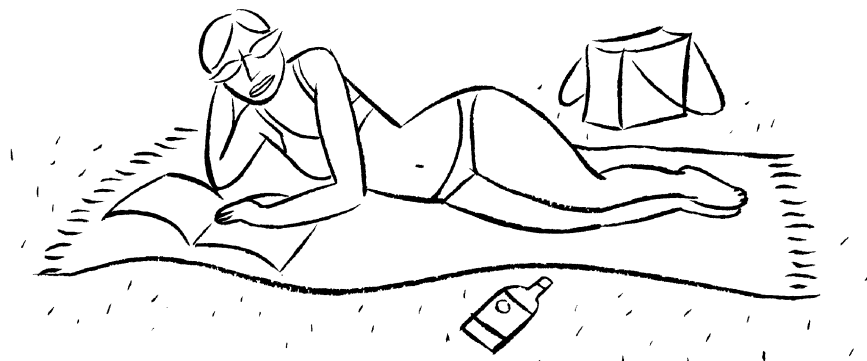
Fig. 3.7 Een passieve vakantie