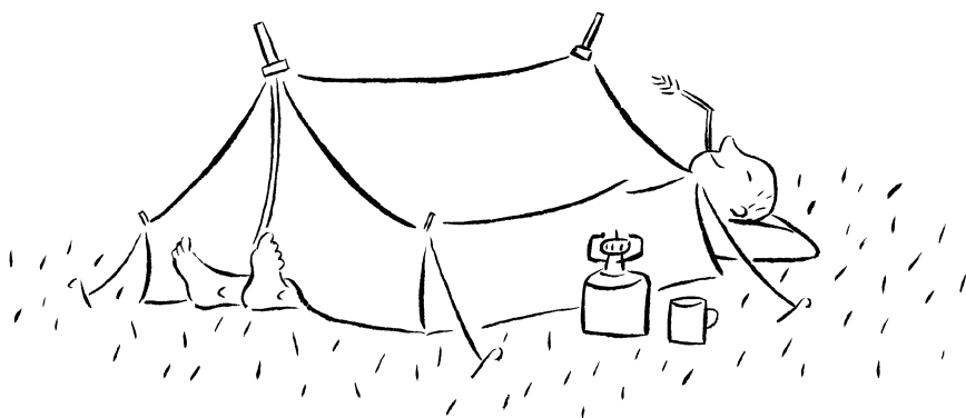
Fig. 3.5 Op de camping